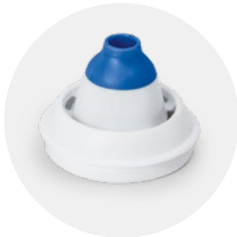
Adattatore nasale dai 12 anni in su Nasal adapter from 12 years old