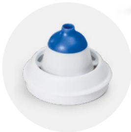
Adattatore nasale fino a 3 anni Nasal adapter up to 3 years