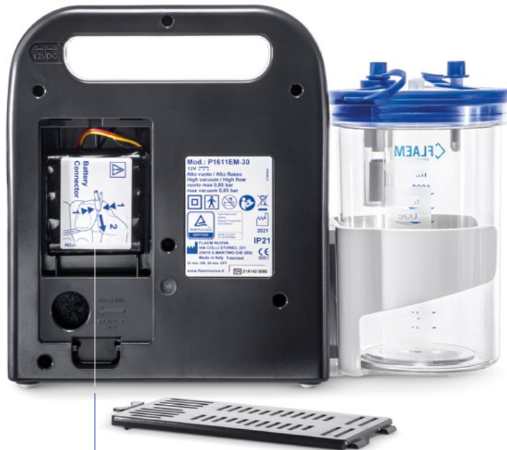
Batteria Li-ion ricaricabile e sostituibile a fine vita Rechargeable and replaceable Li-ion battery at the end of its life