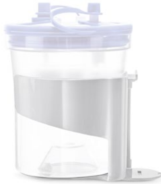
Portavaso aggiuntivo Additional jar-holder