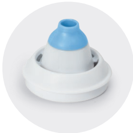
Adattatore nasale dai 12 anni in su Nasal adapter from 12 years old

— 50 — anni di eccellenza italiana years of italian excellence