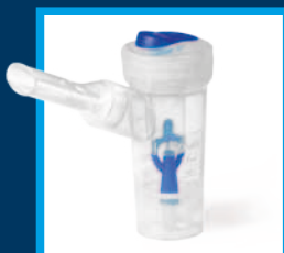
Nuova Ampolla RF7 a due velocità di erogazione del farmaco New RF7Dual Speed nebulizer with 2 delivery modes