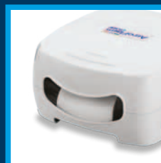
Utile maniglia per il trasporto Convenient carrying handle