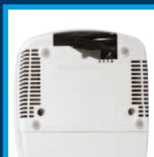
Vano raccogli cavo Cord storage compartment