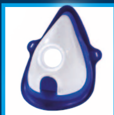
Nuova Mascherina Adulto Soft Touch dotata di morbido bordo a contatto con il viso New Soft Touch adult mask