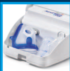
Comodo vano porta accessori igienicamente separato dal vano raccogli cavo Convenient accessories compartment